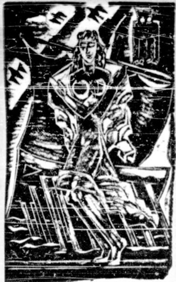
Desen de CRISTEA GROSU